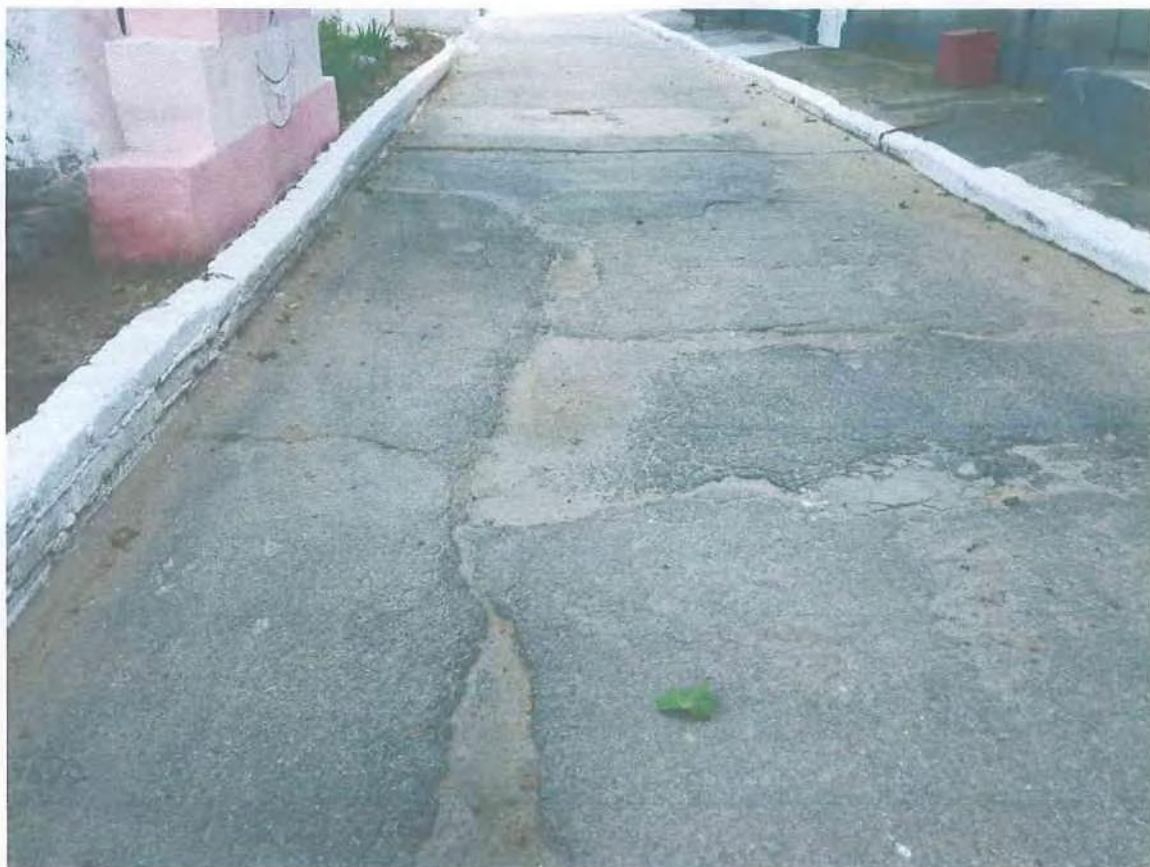
Фото пошкоджених огорожі та асфальтно-бетонних доріжок дитячого садка