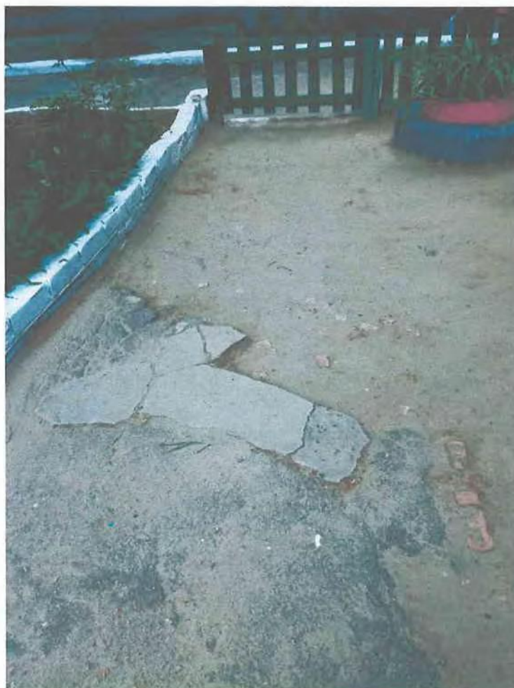
Фото пошкоджених огорожі та асфальтно-бетонних доріжок дитячого садка