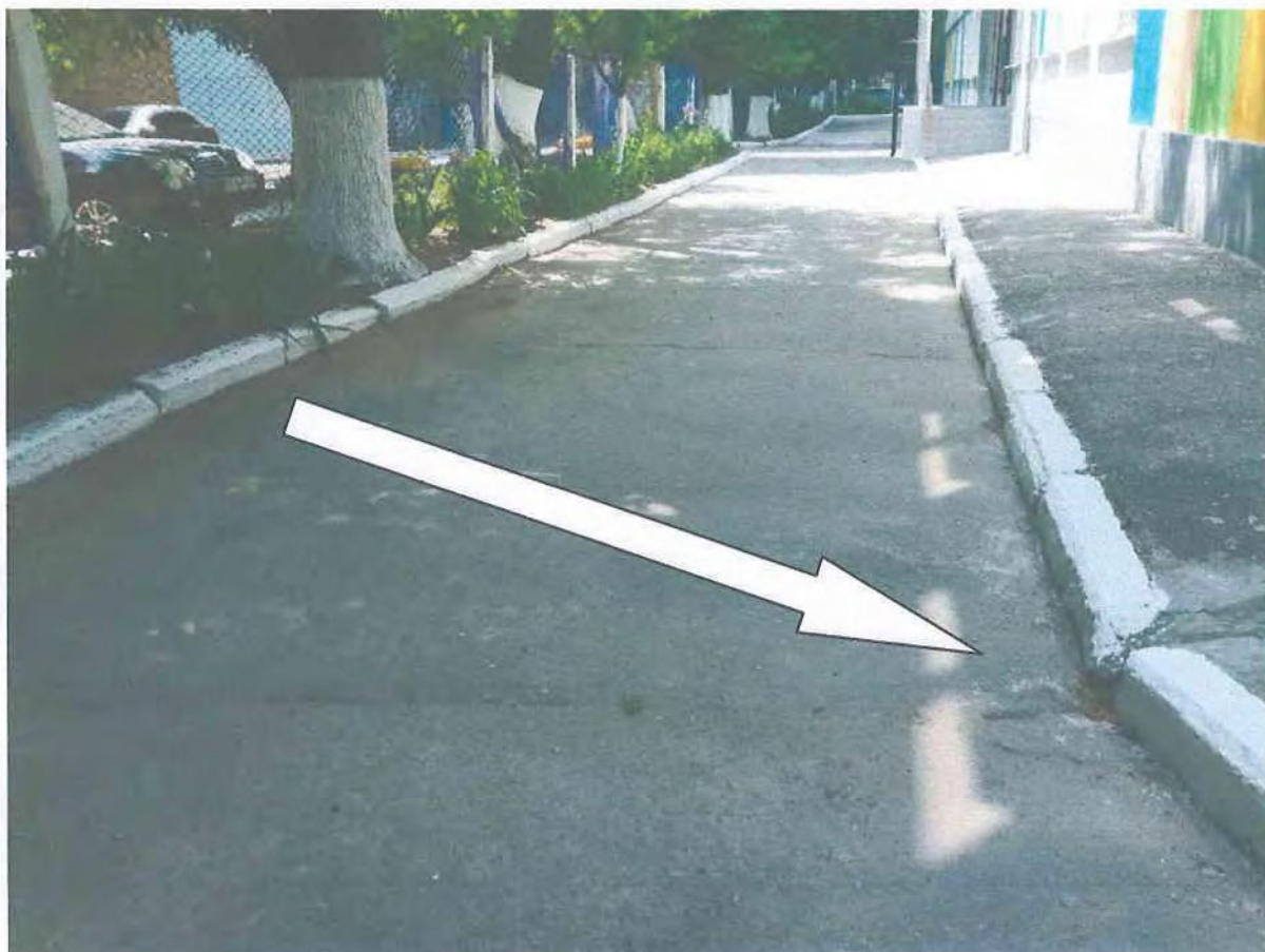
Фото пошкоджених огорожі та асфальтно-бетонних доріжок дитячого садка