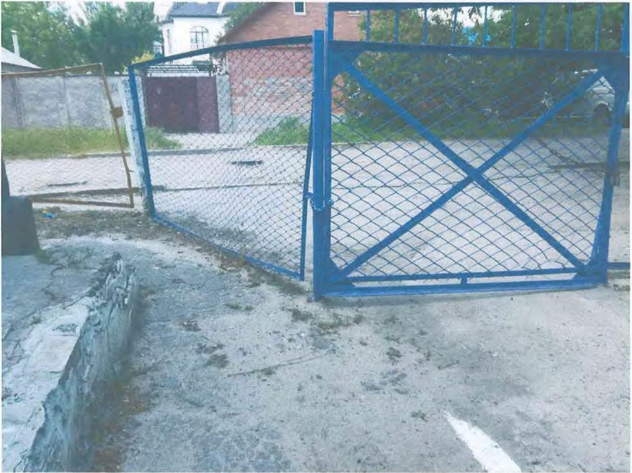
Фото пошкоджених огорожі та асфальтно-бетонних доріжок дитячого садка