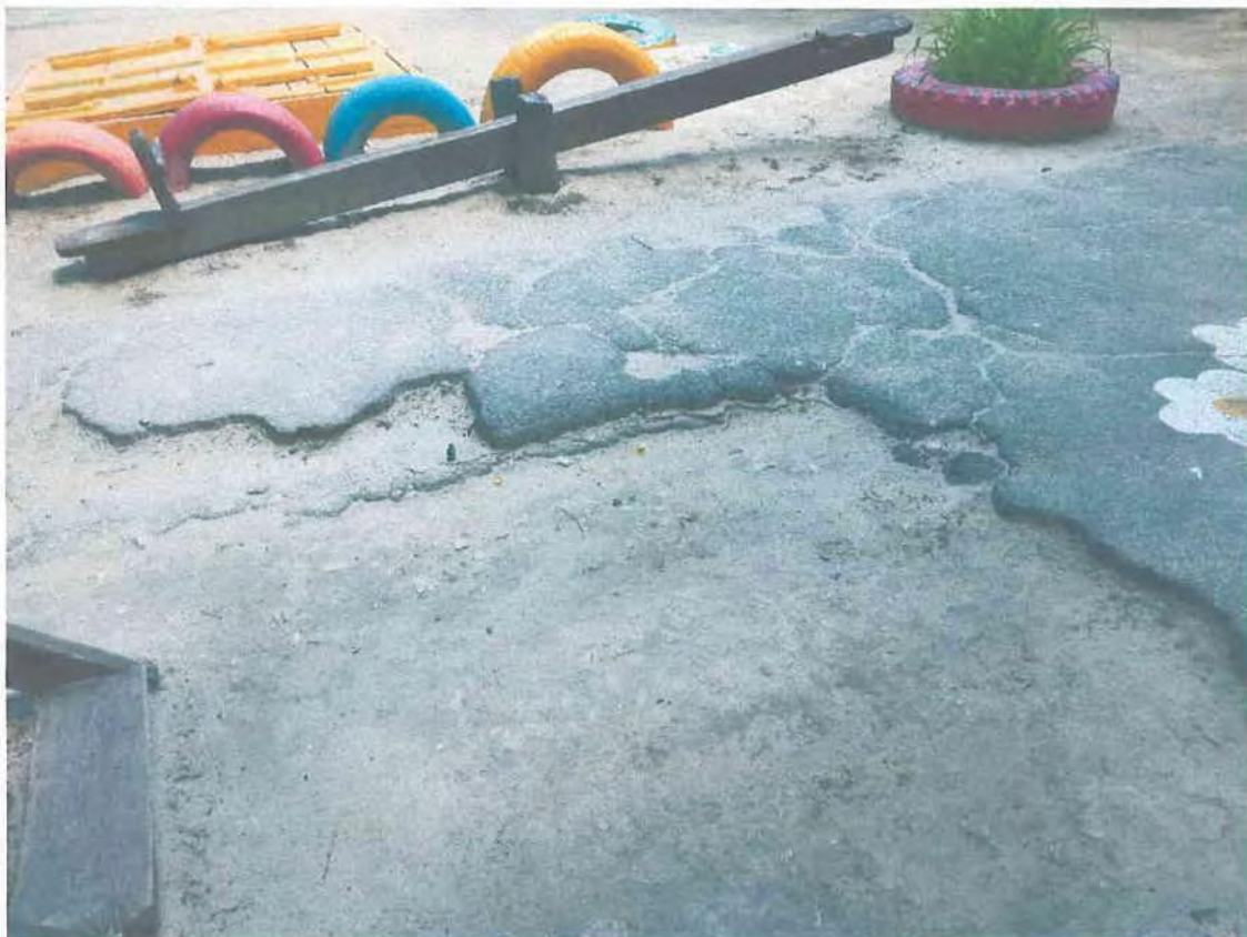
Фото пошкоджених огорожі та асфальтно-бетонних доріжок дитячого садка