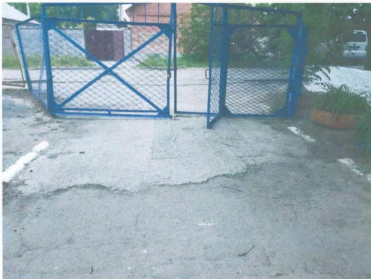
Фото пошкоджених огорожі та асфальтно-бетонних доріжок дитячого садка