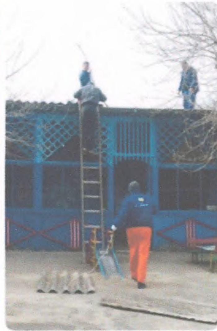
Демонстрація старих навичок